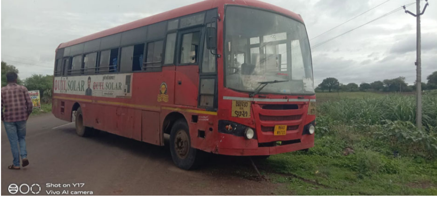
Shot on V17 Vivo AI camera