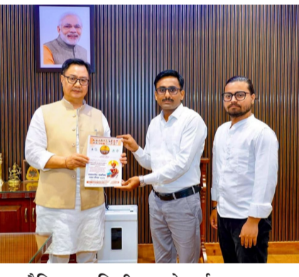
दैनिक यश सिद्धि न्यूज नेटवर्क नवी दिल्ली : २८ जून रोजी महाड येथे होणाऱ्या राज्यस्तरीय सामाजिक न्याय परिषदेस प्रमुख अतिथी म्हणून उपस्थित राहण्याचे निमंत्रण मा. मंत्र्यांना देण्यात आले. तसेच विवेक विचार