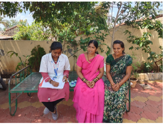
इतर संसर्गजन्य आजाराने लक्षणे असलेल्या नागरिकांची माहिती गोळा केली जात आहे. आरोग्य कर्मचाऱ्यांच्या पथकांकडून घरोघरी जाऊन नागरिकांची तपासणी करण्यात येत

दैनिक यश सिद्धि न्यूज नेटवर्क टाकळीवाडी/प्रतिनिधी : टाकळीवाडी ता शिरोळ परिसरात सध्या तापाच्या रुग्णांची संख्या वाढण्याची शक्यता लक्षात घेऊन आरोग्य विभागाने विशेष सर्वेक्षण मोहीम हाती घेतली आहे. नुकतेच कुंभारवाडी तालुका पन्हाळा येथे एका गावामध्ये शंभर तापाचे रुग्ण आढळल्यामुळे आरोग्य यंत्रणा सतर्क झाली आहे. गावातील प्रत्येक घराला भेट देऊन ताप, सर्दी, खोकला तसेच