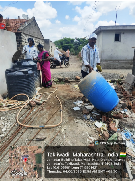
Takliwadi, Maharashtra, India