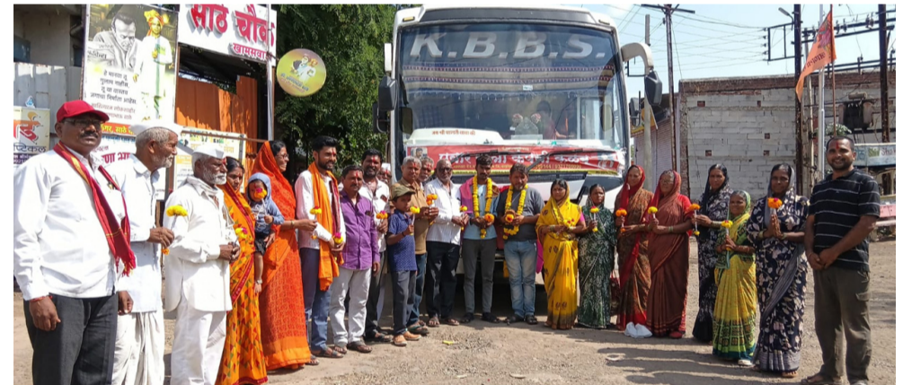
नात्याने मनःपूर्वक स्वागत करून अभिनंदन केले. यावेळी ट्रॅव्हल्सचे चालक व वाहक यांनी अतिशय चांगल्या पद्धतीने सेवा दिल्याबद्दल त्यांचा मानव अधिकार आंदोलन संघटनेचे

दैनिक यश सिद्धि न्यूज नेटवर्क हनुमंत पाटुळे/कळंब प्रतिनिधी : कळंब तालुक्यातील खामसवाडी येथील धार्मिक पर्यटनासाठी गेलेल्या ३५ भाविक भक्तांचे खामसवाडी येथील साठे चौकात स्वागत करण्यात आले. गेल्या एक महिन्यापासून हे भाविक भक्त धार्मिक पर्यटनासाठी महाराष्ट्र, उत्तर प्रदेश, उत्तराखंड (केदार नाथ, बद्रीनाथ), मध्य प्रदेश, गुजरात राजस्थान, पंजाब, जम्मू कश्मीर (वैष्णवी देवी), आणि नेपाळमधील प्रसिद्ध अशा धार्मिक क्षेत्राच्या ठिकाणी दर्शन करून आल्याबद्दल त्यांचे ग्रामस्थ या