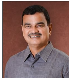
आले आहेत. आता लॅपटॉप वितरणामुळे कृषी विभागाच्या सक्षमीकरणाच्या प्रक्रियेला आणखी बळ मिळणार असून शेतकरी हिताच्या योजनांची अंमलबजावणी अधिक प्रभावीपणे होण्यास मदत होणार आहे.

संघटनांसोबत आयुक्तालय स्तरावर तसेच मंत्रालय स्तरावर बैठका घेऊन त्यांची अडचण व मागणी समजावून घेण्यात आली आहे. या मागणीची दखल घेत शासनाने २०२५-२६ मध्ये या प्रस्तावाला प्राधान्याने मान्यता दिली. या संदर्भात आवश्यक तांत्रिक विनिर्देश इलेक्ट्रॉनिक्स, माहिती तंत्रज्ञान व कृत्रिम बुद्धिमत्ता आयुक्तालयाकडून निश्चित करण्यात आले आहेत. तसेच खरेदी प्रक्रियेत पूर्ण पारदर्शकता आणि स्पष्टता राखण्यासाठी शासकीय ई मार्केटप्लेस (ऱ्हाचू) पोर्टलवर निविदा प्रक्रिया राबवून पुरवठा आदेश देण्यात आले आहेत. राज्यातील १०,६२० सहाय्यक कृषी अधिकारी, १,७७० उपकृषी अधिकारी आणि ८८५ मंडल कृषी अधिकारी अशा एकूण १३,२७५ अधिकारी व कर्मचाऱ्यांना हे लॅपटॉप वितरित केले जाणार आहेत. या सुविधेमुळे क्षेत्रीय स्तरावरील कामकाज अधिक सुलभ होणार असून योजनांची अंमलबजावणी, तपासण्या, माहिती संकलन व अहवाल सादरीकरण यामध्ये मोठ्या प्रमाणावर वेग आणि अचूकता येणार आहे. यापूर्वी नोव्हेंबर २०२५ पासून क्षेत्रीय स्तरावरील अधिकारी व कर्मचाऱ्यांना १२,३७३ सिमकार्डचे वितरण करण्यात आले असून एप्रिल २०२६ मध्ये तालुकास्तरावर ४४४ नवीन संगणक उपलब्ध करून देण्यात