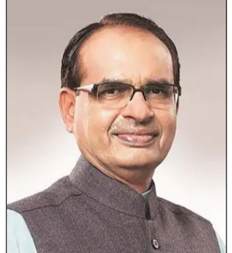
दैनिक यश सिद्धि न्यूज नेटवर्क नवी दिल्ली : महाराष्ट्रातील हरभरा (चना) उत्पादक शेतकऱ्यांना केंद्र

केली आहे. ही समिती राज्यातील विविध मतदारसंघांना भेटी देऊन तिथे झालेल्या कथित गैरप्रकारांचा अहवाल तयार करेल. हा विजय जनतेचा नसून सत्तेचा गैरवापर करून मिळवलेला विजय आहे. आम्ही पुन्हा फिनिस पक्षाप्रमाणे राखतून झेप घेऊ, असा ठाम विश्वास त्यांनी व्यक्त केला. केंद्र सरकारला देशात केवळ एकपक्षीय राजवट आणायची असून, यामुळे जागतिक स्तरावर भारताच्या लोकशाहीची प्रतिमा मलिन होत असल्याची टीका त्यांनी शेवटी केली.