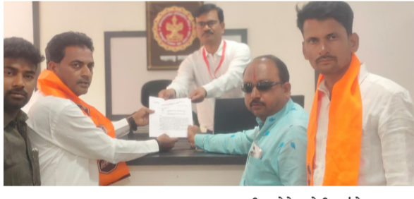
उभे करणारी घटना आहे या घटनेने महाराष्ट्राच्या मातीला काळीमा फासला असून, म नवतेचा कळसच ढासळल्याचे चित्र समोर आले आहे. या राक्षसी कृत्य कर्णाच्या गुन्हेगारांना कोणतीही दया ना दाखवता फासावर चढवावे राज्यात खून,बलात्कार,डग्न तस्करी,दरोडे चोरी यांचे प्रमाण जास्त आहे गुहमंत्री कांहीच कार्यवाही करत

दैनिक यश सिद्धि न्यूज नेटवर्क पंढरपूर/प्रतिनिधी : दिनांक ४ मे रोजी महाराष्ट्र नवनिर्माण सेनेच्या वतीने जिल्हाधिकारी यांच्या मार्फत महाराष्ट्र राज्याचे राज्यपाल साहेब यांना निवेदन देण्यात आले यात मौजे नरसापूर तालुका भोर जिल्हा पुणे येथे एक चार वर्षांच्या लहान मुली-वर बलात्कार करून तिची हत्या करण्यात आली तसेच काल चाकण येथे ३वर्षांच्या मुलीवर बलात्कार करून अमानुष खून, अत्याचार तिची निर्दयी हत्या हि केवळ संतापजनक नाही तर संपूर्ण समाजव्यवस्थेच्या संवेदनशीलतेवरच प्रश्नचिन्ह