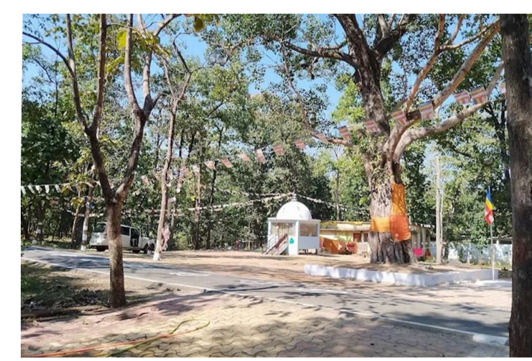
इमारतीच्या निकृष्ट बांधकामामुळे फटी पडल्या आहेत. अनेक इमारतींचा भाग हा कमकुवत झाला आहे. शौचालय व नळफिटिंग हे उत्तम दर्जाचे करण्यात आले नाही व त्यात स्वच्छतागृह चांगले नाही. या स्थळाकडे कुणाचेही लक्ष नाही. विधानसभा क्षेत्रातील लोकप्रतिनिधी विशेष लक्ष घालत नाही. कंत्राटदार लोकप्रतिनिधी असून या पर्यटनस्थळाचा समाज बांधव व समितीचा