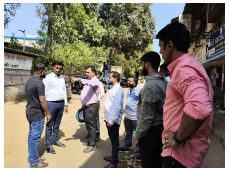
प्रत्यक्ष पाहणी करून नागरिकांच्या समस्या समजावून सांगितल्या व त्यावर कार्यवाही केली.