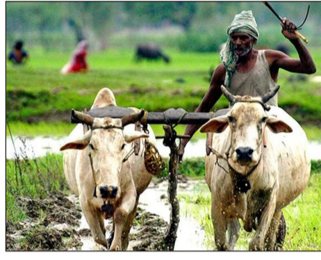
त्यांनी सांगितले. यामुळे केवळ जमिनीचे आरोग्य सुधारणार नाही, तर शेतकऱ्यांचा उत्पादन खर्चही कमी होईल. पंतप्रधानांनी सध्याच्या जागतिक परिस्थितीवर चिंता व्यक्त केली. कोरोना महामारी आणि त्यानंतरच्या आर्थिक संकटातून जग सावरत असतानाच, आता पश्चिम आशियातील युद्धजन्य परिस्थितीने नवीन संकट उभे केले आहे. या युद्धाचा थेट परिणाम जागतिक पुरवठा साखळीवर (डीपीआर उद्भवणारा) होत असून भारतालाही त्याचे चटके सोसावे लागत आहेत. हे या दशकातील मोठे संकट आहे,

गरज: रासायनिक खतांपासून मुक्ती शेती ही आपली माता आहे आणि तिला रासायनिक खतांच्या विळख्यातून बाहेर काढणे ही आपली जबाबदारी आहे, अशा भावनिक शब्दांत पंतप्रधानांनी शेतकऱ्यांशी संवाद साधला. आपण सर्व शेतीपुत्र आहोत, त्यामुळे जमिनीचा कस टिकवण्यासाठी आता रासायनिक शेतीला पूर्णविराम देऊन नैसर्गिक शेतीचा (ऑर्गेनिक क्रीमिअल) मार्ग स्वीकारणे काळाची गरज असल्याचे