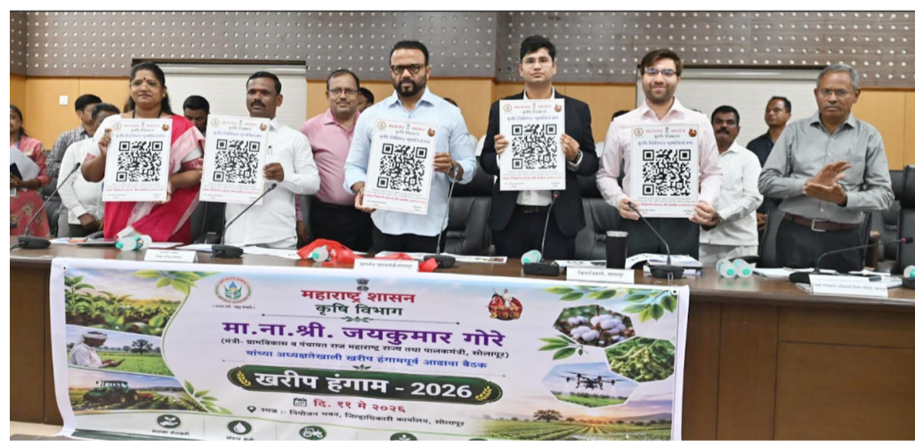
शेतकऱ्यांची एकदा इ केवायसी झाल्यानंतर पुन्हा पुन्हा ई केवायसी

तसेच बियाणे पुरवठा करणाऱ्या कंपन्यांकडून कृषी विभागाने वेळेवर खते व बियाणे उपलब्ध करून घ्यावेत तसेच विक्रेत्यांमार्फत विनालिंकिंग शेतकऱ्यांना उपलब्ध करून घ्यावेत. जे निविदा विक्रेते लिंकिंग करून शेतकऱ्यांना बोगस खते व बियाणे विकत असतील अशा विरोधात प्रशासनाने कठोर कारवाई करावी. यामध्ये लोकप्रतिनिधी तसेच अधिकाऱ्यांनी अत्यंत संवेदनशील होऊन काम करावे व लिंकिंग होऊ देऊ नये. पोलीस विभागाने यासंबंधी तक्रारी प्राप्त झाल्यावर त्यावर तात्काळ गुन्हे दाखल करून घ्यावेत, असेही त्यांनी निर्देशित केले. मागील वर्षी अतिवृष्टी व