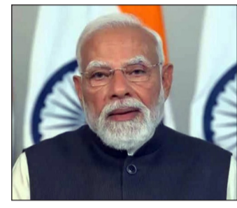
परिस्थिती सामान्य होत नाही, तोपर्यंत आपल्याला उपभोग कमी करून कर्तव्याला प्राधान्य द्यावे लागेल, असे मोदी म्हणाले. इंधन आणि खाद्यतेल बचतीसाठी 'लाईफस्टाईल' मध्ये बदल

पण आपण एकत्रितपणे यातून नक्कीच मार्ग काढू, असा विश्वास त्यांनी व्यक्त केला. परकीय चलनाचा ओघ रोखण्यासाठी छोटे संकल्प भारत कच्च्या तेलासाठी आणि खाद्यतेलासाठी मोठ्या प्रमाणात परकीय चलन (ट्रेडिडसप ए-लहरपसश) खर्च करतो. जागतिक संकटामुळे या वस्तूंच्या किमती गगनाला भिडल्या आहेत. हा आर्थिक बोजा कमी करण्यासाठी पंतप्रधानांनी नागरिकांना 'छोटे संकल्प' करण्याचे आवाहन केले आहे. जोपर्यंत