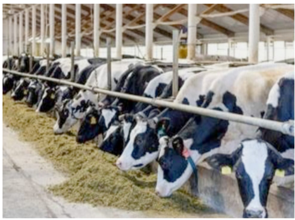
किसान कार्ड आहे. त्यांना तीन कर्जाचा मूळ व्याजदर ९% असला तरी नियमित कर्जफेड करणाऱ्या शेतकऱ्यांना केंद्र सरकारकडून तीन टक्के

दैनिक यश सिद्धि न्यूज नेटवर्क पंढरपूर/प्रतिनिधी : राज्यातील पशुपालन शेळी मेंढी पालन, कुकूटपालनास आणि वराह पालन करणाऱ्या शेतकऱ्यांना आर्थिक आधार देण्यासाठी पशुसंवर्धन विभागातर्फे पशुसंवर्धन किसान क्रेडिट कार्ड (के सी सी) मोहिम राबवण्यात येत आहे. या योजनेअंतर्गत ज्या शेतकऱ्यांकडे किसान क्रेडिट कार्ड नाही, त्यांना एक लाख ६० हजार रुपयांपर्यंत चेक कर्ज वितरण उपलब्ध करून दिले जाईल. दूध संस्थेने आम्ही दिल्यास ही मर्यादा तीन लाखांपर्यंत वाढवता येते. ज्याच्याकडे आधीच