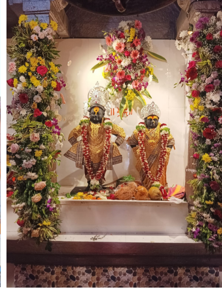
नामाचा जयघोष करत मिरवणूक उगाव रोड मार्गे मंदिरात पोहोचली. यामध्ये सजवलेले उंट, तसेच संगीताच्या तालावर नृत्य सादर