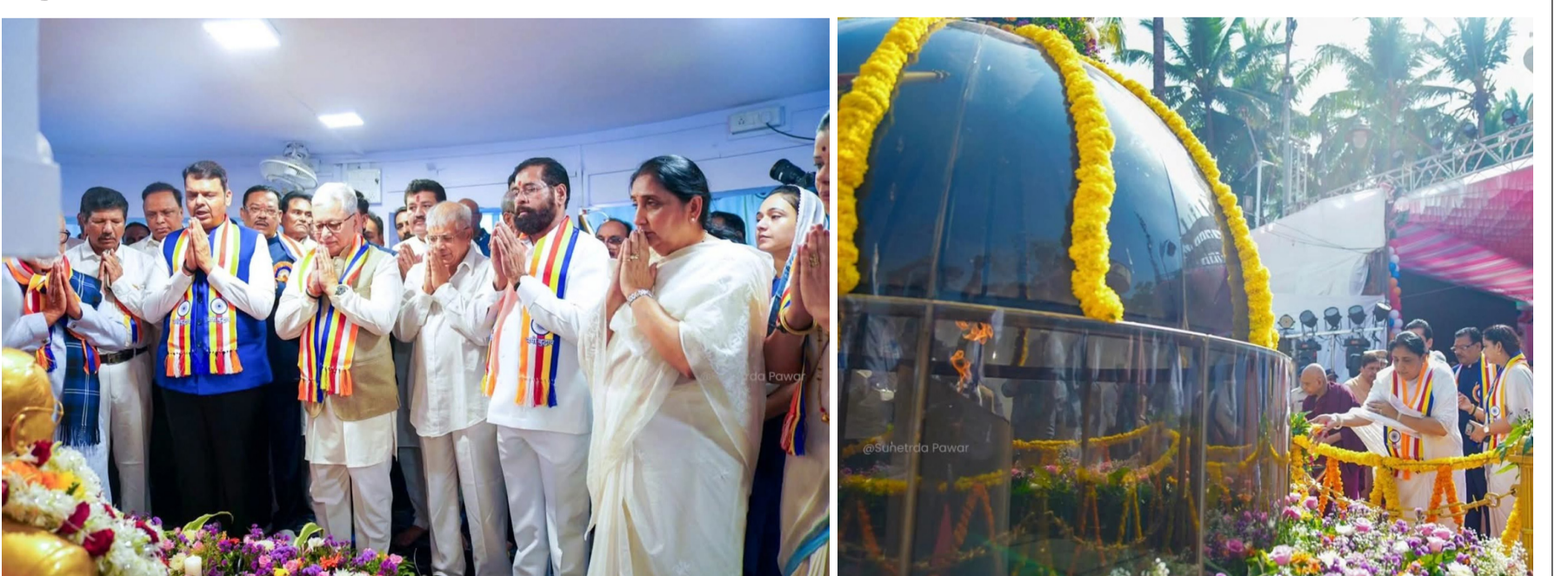
दैनिक यश सिद्धि न्यूज नेटवर्क : महाराष्ट्र राज्याचे राज्यपाल मा. श्री. जिणू देव वर्मा जी, मुख्यमंत्री मा. श्री. देवेंद्रजी फडणवीस आणि उपमुख्यमंत्री मा. श्री. एकनाथजी शिंदे यांच्यासमवेत आज दादर येथील चैत्यभूमी येथे जाऊन महामानव, भारतरत्न डॉ. बाबासाहेब आंबेडकर यांच्या १३५ व्या जयंतीनिमित्त त्यांच्या स्मृतींना कृतज्ञतापूर्वक अभिवादन केले.