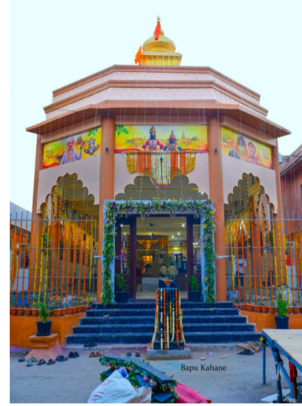
मुली, त्यानंतर वारकरी मंडळ सहभागी झाले होते. श्री विठ्ठल

दैनिक यश सिद्धि न्यूज नेटवर्क निफाड/प्रतिनिधी : निफाड श्री विठ्ठल-रुक्मिणी देवस्थानच्या वतीने निफाड येथील पुरातन श्री विठ्ठल-रुक्मिणी मंदिरात श्री विठ्ठल-रुक्मिणीच्या नवीन मूर्तीच्या प्राणप्रतिष्ठा व कलशरोहन सोहळ्याचा भव्य धार्मिक उत्सव उत्साहपूर्ण वातावरणात संपन्न झाला. चार दिवस चाललेल्या या सोहळ्यात भाविकांचा मोठा सहभाग पाहायला मिळाला. गुरुवारी सकाळी मंदिरापासून मिरवणुकीला प्रारंभ करण्यात आला. सजवलेल्या रथामध्ये श्री विठ्ठल-रुक्मिणीची नवीन मूर्ती तर आकर्षक बैलगाडीत कलश ठेवण्यात आला होता. मिरवणुकीच्या अग्रभागी कलशधारी