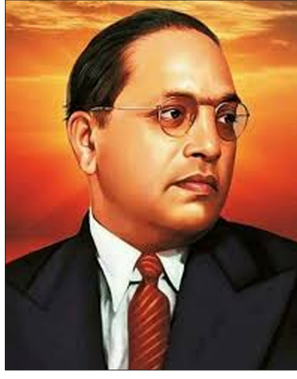
दैनिक यश सिद्धि न्यूज नेटवर्क

इराणने शत्रू देशांसाठी होमुझ सामुद्रधुनी बंद केली असली तरी, भारतीय जहाजे ती सहजपणे प्रवास करत आहेत. इराणने भारतीय जहाजांना एकप्रकारे फ्री-एन्ट्री दिली असून भारताला अघोषित टोल आणि वाहतूक शुल्कातूनही सूट दिली होती. मात्र आता अमेरिकेकडून होमुझ नाकेबंदी भारतासाठी डोकेंदुखी बनू शकते. अमेरिकेचे नौदल होमुझ सामुद्रधुनी ओलांडणाऱ्या कोणत्याही जहाजावर हल्ला करण्याची शक्यता असून ट्रम्प यांनी स्पष्टपणे सांगितले आहे की, टोल यापुढे सहन केला जाणार नाही. परिणामी, टोल भरूनही होमुझमधून जाणाऱ्या कोणत्याही देशाला अमेरिकेकडून शत्रू म्हणून घोषित केले जाईल. अमेरिकेविरुद्ध तग धरून उभं असलेला इराण सध्या होमुझमधून अत्यंत कमी प्रमाणात जहाजांच्या वाहतुकीला परवानगी देत आहे. त्याचवेळी, इराण प्रत्येक जहाजामागे २० लाख डॉलर्सपर्यंत टोल आकारून काही टॅक्सना जाऊही देत असल्याचे अहवालातून समोर आलेले. याहूनही महत्वाचे म्हणजे इराणने या प्रदेशातून प्रामुख्याने फक्त आपल्या तेलाचाच ये-जा करण्याची परवानगी दिली आहे. अशा परिस्थितीत, अमेरिकेच्या कोणत्याही नाकेबंदीमुळे तेहरानचे आर्थिक नुकसान होण्याची शक्यता आहे, ज्यामुळे तेल निर्यात करण्याची आणि महसूल मिळवण्याची क्षमता नाकारली जाईल आणि परिणामी दीर्घकाळ लढा सुरू ठेवायची क्षमता कमी होऊ शकते.