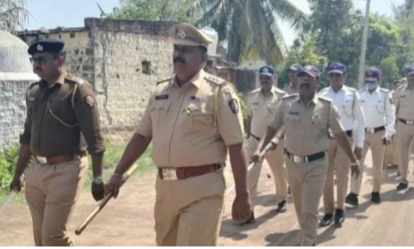
मिरवणूक मार्ग वस्ती बस स्टॅन्ड या भागातून रूटमार्क घेण्यात आला रूट मार्चमध्ये पंढरपूर अंमलदार यांनी सहभाग नोंदवला आहे.