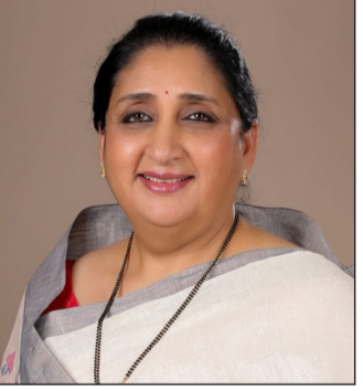
विधिमंडळातील पहिल्यां भाषणात सगळ्यांचे लक्ष वेधले

दैनिक यश सिद्धि न्यूज नेटवर्क मुंबई: जागतिक महिला दिनाचे औचित्य साधत विधिमंडळ अधिवेशनात राज्याच्या नवनिर्वाचित उपमुख्यमंत्री सुनेत्रा पवार राज्यातील महिला कर्मचाऱ्यांसाठी मोठी घोषणा केली. लवकर या, लवकर जा.. म्हणत महिलांना कामाच्या ठिकाणी लवकर आल्यास लवकर जाण्याची मुभा देण्यात येणार आहे. आम्ही घोषणा करत आहोत की, मुंबई महानगर क्षेत्रातील शासकीय कर्मचारी महिलांसाठी उेश शरीश्रू के शरीश्रू प्रणाली लागू करण्यात येत आहे. शासकीय नोकरीत असलेल्या महिला सकाळी ९.१५ वाजता कार्यालयात आल्या तर घरी जाताना त्यांना अर्धा तास लवकर सोडण्यात येईल, अशी घोषणा सुनेत्रा पवार यांनी विधानपरिषदेतून केली.