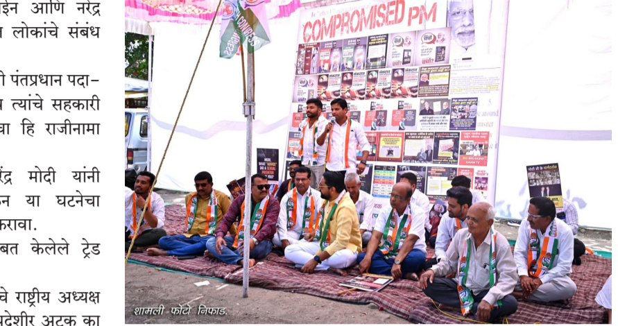
शमली फाटी निफाड