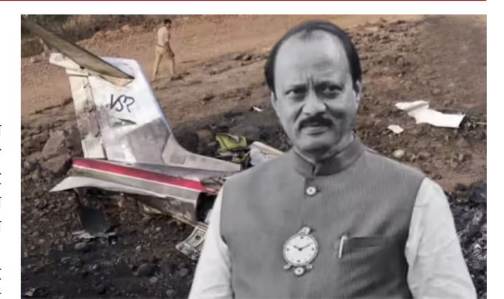
फायर-फायटिंग यंत्रणा उपलब्ध नव्हती. फ्लायट डेटा रेकॉर्डमधील माहिती डाउनलोड करण्यात आली आहे. तर कॉकपिट व्हाईस रेकॉर्डची माहिती मिळवण्यासाठी प्रयत्न केला जात आहे. ते काम देखील प्रगतीत आहे, अशी माहिती अहवालात देण्यात आली आहे.

मिळवण्यासाठी प्रयत्न केला जात आहे. ते काम देखील प्रगतीत आहे, अशी माहिती अहवालात देण्यात आली आहे. फायर-फायटिंग यंत्रणा उपलब्ध नव्ह-ती. फ्लायट डेटा रेकॉर्डमधील माहिती डाउनलोड करण्यात आली आहे. तर कॉकपिट व्हाईस रेकॉर्डची माहिती मिळवण्यासाठी प्रयत्न केला जात आहे. ते काम देखील प्रगतीत आहे, अशी माहिती अहवालात देण्यात आली आहे.