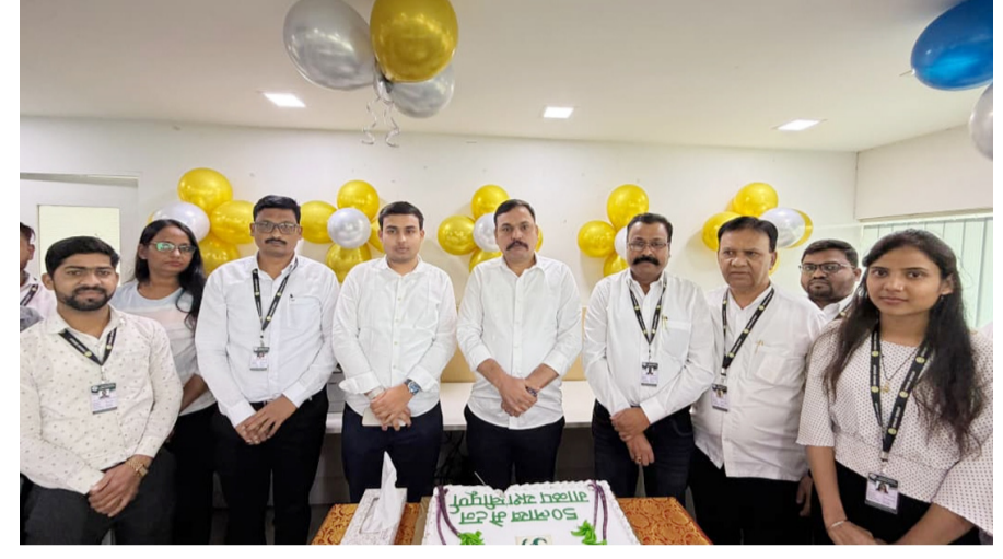
सातत्याने पुढे नेत राहिल, असा ठाम विश्वास शेतकऱ्यांतून व्यक्त होत आहे.

आहे. या माध्यमातून केवळ साखर उत्पादनच नव्हे तर शेतकऱ्यांचे आर्थिक सक्षम करण, ग्रामीण अर्थव्यवस्थेचा विकास आणि स्थानिक पातळीवर रोजगारनिर्मिती साधली जात आहे. भविष्यातही शेतकरी केंद्रबिंदू ही भूमिका कायम ठेवत, ओंकार शुगर ग्रुप शेतकरी हितासाठी, ग्रामीण विकासासाठी आणि विश्वासाह उद्योग समूह म्हणून वाटचाल