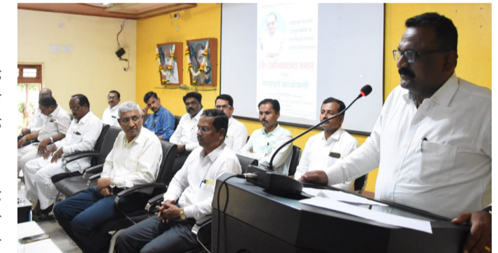
महाविद्यालयातील वरिष्ठ-कनिष्ठ, व्होकेशनल विभागातील कर्मचारी तसेच रयत शिक्षण संस्थेच्या विविध शाखांमधील सेवानिवृत्त शिक्षक व रयतप्रेमी नागरिक मोठ्या संख्येने उपस्थित होते.