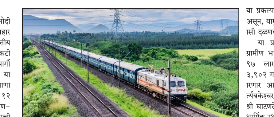
महत्त्वाच्या अशा कसारा - मनमाड उभारला जाणार आहे. या वाढीव रेल्वे क्षमतेमुळे वाहतुकीतील कोंडी कमी होऊन रेल्वे सेवेची विश्वासार्हता आणि कार्यक्षमता वाढणार आहे. पीएम गती या मार्गावरही ३ रा आणि ४ था मार्ग

दैनिक यश सिद्धि न्यूज नेटवर्क नवी दिल्ली : प्रधानमंत्री नरेंद्र मोदी यांच्या नेतृत्वाखालील आर्थिक व्यवहार विषयक मंत्रिमंडळ समितीने भारतीय रेल्वेच्या पायाभूत सुविधांना बळकटी देणाऱ्या तीन महत्त्वाच्या बहुमार्गी प्रकल्पांना मंजुरी दिली आहे. या निर्णयामुळे महाराष्ट्र, दिल्ली, हरियाणा आणि कर्नाटक या चार राज्यांतील १२ जिल्हांमध्ये रेल्वेचे जाळे विस्तारणार असून, एकूण ३८९ किलोमीटरची भर पडणार आहे. १८,५०९ कोटी रुपये अंदाजे खर्च असलेले हे प्रकल्प २०३०-३१ पर्यंत पूर्ण करण्याचे उद्दिष्ट ठेवण्यात आले आहे. यामध्ये महाराष्ट्रासाठी अत्यंत