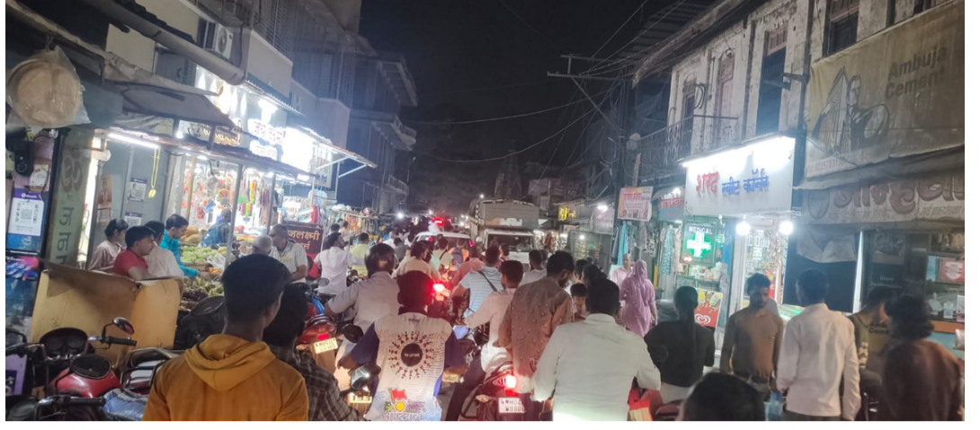
तसेच पडधा ग्रामपंचायतीने तातडीने वाहतूक नियंत्रण, पार्किंग व्यवस्था आणि रस्ते नियोजनाबाबत ठोस उपाययोजना कराव्यात, अशी जोरदार मागणी नागरिकांकडून होत आहे. पडध्यातील वाढत्या वाहतूक कोंडीवर कायमस्वरूपी तोडगा निघणार का, याकडे आता सर्वांचे लक्ष लागले आहे.

करतात. त्यामुळे रस्ता आणखी अरुंद होऊन वाहतूक ठप्प होते. अनेकदा पादचार्यांना वाहनांच्या मधून पायवाट काढणेही कठीण बनते. दिवसभर रस्त्यांवर उभ्या असलेल्या वाहनांमुळे आणि अनियंत्रित वाहतुकीमुळे सायंकाळी कोंडी ही नित्याचीच समस्या झाली आहे. विशेष म्हणजे, वाहतूक कोंडी होत असतानाही संबंधित ठिकाणी वाहतूक पोलीसांची अनुपस्थिती नागरिकांच्या नाराजीचे कारण ठरत आहे. या पार्श्वभूमीवर पडधा पोलिस