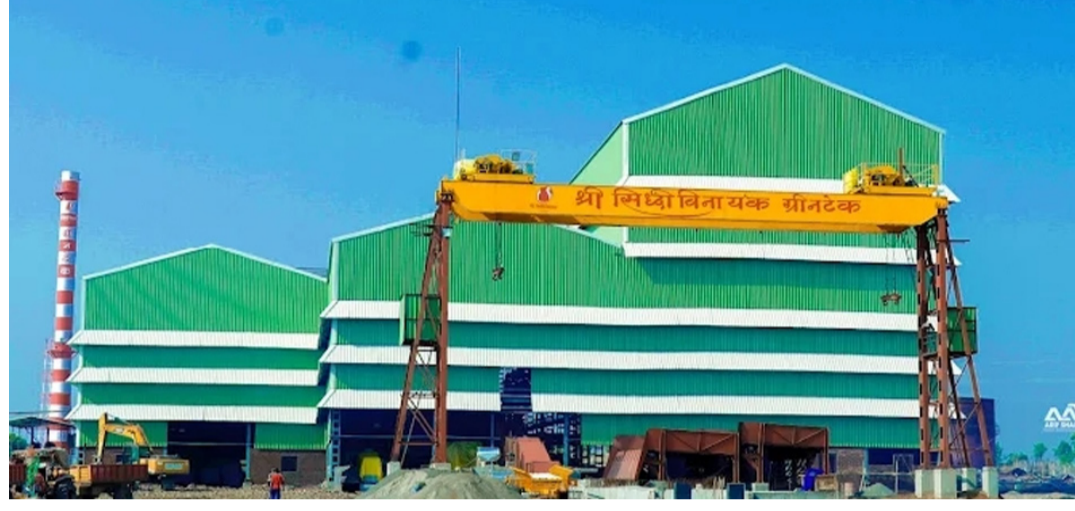
चवस्था करावी, असे आवाहन कारखान्याने स्पष्ट केले आहे की, उसाबाबत कारखाना जबाबदार राहणार दिलेल्या मुदतीनंतर शिल्लक राहिलेल्या नाही. तसेच सर्व तोडणी व वाहतूक