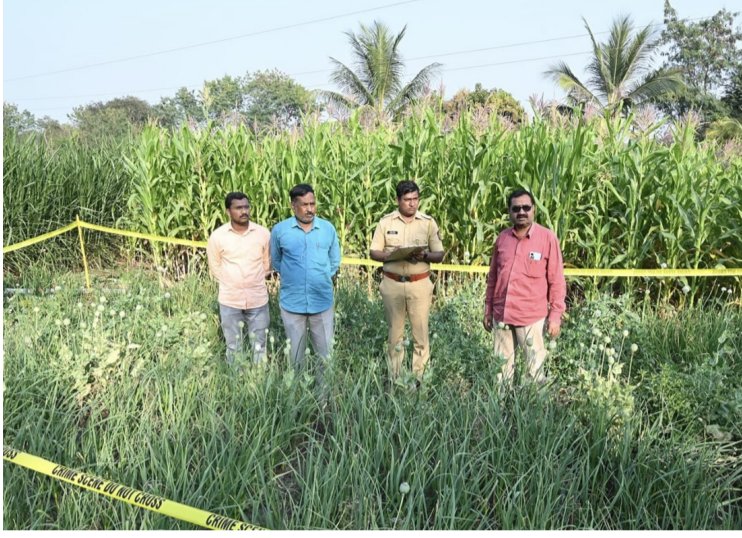
पाहिले असता पानगाव येथील बाबासाहेब अफूची झाडे आढळून आली साडेचार वाघमारे यांचे सदरचे शेत गट नं. १४१ / व ४ यांच्या शेतामध्ये मोठ्या प्रमाणात

दैनिक यश सिद्धि न्यूज नेटवर्क कळंब प्रतिनिधी/सुधाकर रणदिवे : कळंब तालुक्यातील पानगावमध्ये अफूच्या अवैध लागवडीचा मोठा प्रकार उघडकीस आला असून येरमाळा पोलिसांनी मोठी कारवाई करत लाखो रुपयांचे अफूचे पीक जप्त केले आहे. या कारवाईमुळे तालुक्यात एकच खळबळ उडाली असून अवैध अंमली पदार्थांच्या लागवडी विरोधात पोलिस कारवाई करत असल्याचे दिसून येत आहे.