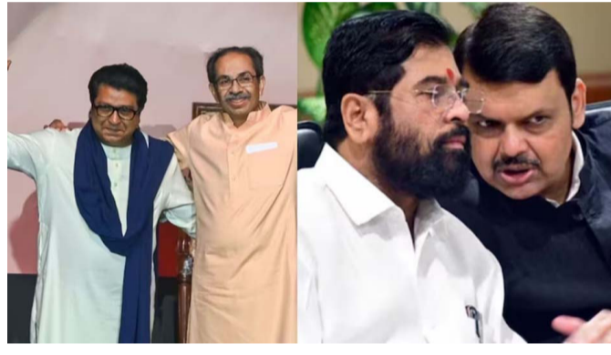
शक्यता वर्तवण्यात आली आहे. गत एक्झिट पोलनुसार, मुंबईत त्याचवेळी इतर पक्षांना ७ जागा मिळण्याची शक्यता वर्तवण्यात आली आहे. भाजपची सत्ता येणार असून सर्वाधिक मतदान टक्काही त्या पक्षाला मिळणार आहे. या अंदाजानुसार कोणत्या

पार पडलं. त्याचा निकाल १६ जानेवारी रोजी जाहीर करण्यात येणार आहे. त्या आधी या निकालाचा अंदाज वर्तवणारे एक्झिट पोल समोर आले आहेत. मुंबई महापालिकेसाठी जनमतचा एक्झिट पोल समोर आला आहे. त्यानुसार भाजप आणि शिंदे यांच्या युतीला १३८ जागा मिळणार असल्याचा अंदाज व्यक्त करण्यात आला आहे. त्याचवेळी ठाकरे बंधू आणि पवारांच्या राष्ट्रवादीला फक्त ६२ जागा मिळतील असे म्हटलेले आहे. दुसरीकडे, काँग्रेस आणि वंचित जागांसाठी १५ जानेवारी रोजी मतदान