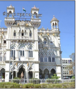
शिंदे यांना बसण्याची शक्यता आहे. काँग्रेसला केवळ १२ जागांवर समाधान मानावे लागण्याची चिन्हे असून, भाजपच्या ६२ जागांच्या झंझावातापुढे काँग्रेसचा धोक्यात आल्याचे चित्र आहे. जर हे आकडे निकालात बदलले, तर सोलापूरच्या राजकारणात हा मोठा फेरबदल ठरेल. दुसरीकडे, शिंदे सेनेनेही १५ जागांसह आपली ताकद दाखवून दिली आहे. मतदारांचा हा कल प्रत्यक्ष निकालात परावर्तित होतो का, हे उद्या १६ जानेवारी रोजी होणाऱ्या मतमोजणीनंतरच स्पष्ट होईल. मात्र, सध्या तरी सोलापूरमध्ये भाजपच्या गोदात उत्सवाचे वातावरण आहे.

अटीतटीची लढत पाहायला मिळाली. स्थानिक मुद्द्यांपासून ते राज्याच्या राजकारणापर्यंत अनेक विषय प्रचारात गाजले. अखेर आज मतदारांनी आपला कौल ईव्हीएममध्ये बंद केला आहे. दरम्यान, या एक्झिट पोलने विविध केंद्रांवर घेतलेल्या कलानुसार, सोलापूरकरांनी विकासाच्या मुद्द्यावर भाजपला झुकते माप दिल्याचे दिसत आहे. सामच्या एक्झिट पोलनुसार, सोलापूर महापालिकेच्या एकूण जागांपैकी भाजपला सर्वाधिक जागा मिळताना दिसत आहेत. या पोलनुसार सोलापूरची संभाव्य आकडेवारी खालीलप्रमाणे आहे. पक्ष, अंदाजित जागा भारतीय जनता पार्टी-६२