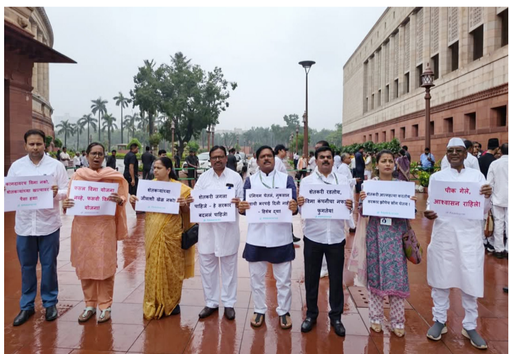
शेतकऱ्यांच्या खात्यात थेट पैसे हवेत, पिक विमा योजना - शेतकऱ्यांची लूट,

दैनिक यश सिद्धि न्यूज नेटवर्क नवी दिल्ली : केंद्र सरकारने शेतकऱ्यांसाठी लागू केलेली 'एक रुपयात पिक विमा योजना' बंद केल्याच्या निषेधार्थ खासदार प्रणिती शिंदे यांच्या नेतृत्वाखाली महाराष्ट्रातील काँग्रेसचे खासदारांनी नवी दिल्लीतील संसद भवन परिसरात जोरदार निदर्शने करत ही योजना पुन्हा सुरू करण्याची मागणी केली. यावेळी आंदोलनादरम्यान शेतकरी रडतोय - विमा कंपनी नफा फुगवतेय, शेतकरी आत्महत्या करतोय - सरकार झोपेचे सोंग घेतोय, पिक गेले - आश्वासन राहिले, शेतकऱ्यांच्या जीवाशी खेळू नका, फसल विमा योजना नव्हे - फसवी विमा योजना, कागदावर विमा नको -