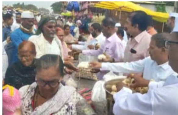
दिवशी भावी भक्तांना उप-साचे फराळ वाटप करण्यात येत असते त्याचप्रमाणे याही वर्षी देखील दि. पंढरपूर मर्चंट को-

दैनिक यश सिद्धि न्यूज नेटवर्क पंढरपूर/प्रतिनिधी : आषाढी यात्रेच्या निमित्ताने आळंदी ते पंढरपूर पायी चालणाऱ्या भाविकांना भक्तांना आषाढी एकादशीनिमित्त दि. पंढरपूर को-ऑपरेटिव्ह बँक यांच्यावतीने आज रोज वारकरी भाविक भक्तांना उपासाचे व फराळ यांचे वाटप करण्यात आले.