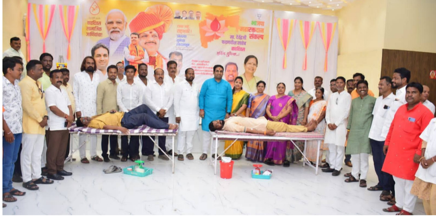
बँक यांनी रक्तसंकलन केले.

दैनिक यश सिद्धि न्यूज नेटवर्क सोलापूर/प्रतिनिधी : मुख्यमंत्री देवेंद्र फडणवीस यांच्या वाढदिवसानिमित्त शहर मध्य विधानसभा मतदारसंघात मंगळवारी ९४३ जणांनी विक्रमी रक्तदान केले. शहर मध्य मतदारसंघात तीन ठिकाणी शिबिरांचे आयोजन करण्यात आले होते.