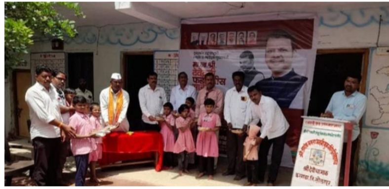
दैनिक यश सिद्धि न्यूज नेटवर्क

पंढरपूर/प्रतिनिधी : सुसूत्रता, बेरोजगारांसाठी