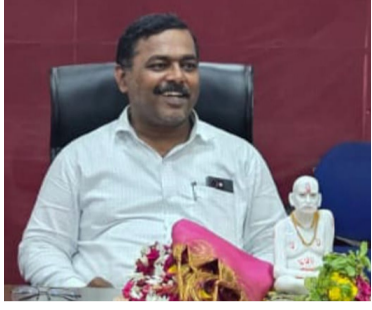
दैनिक यश सिद्धि न्यूज नेटवर्क अक्कलकोट/ प्रतिनिधी : सन २०२५-२६ यावर्षाच्या २०% मागासवर्गीय कल्याण निधी व ५% अपंग कल्याण निधी अंतर्गत वैयक्तिक योजनेचे अर्ज स्विकारणे चालू