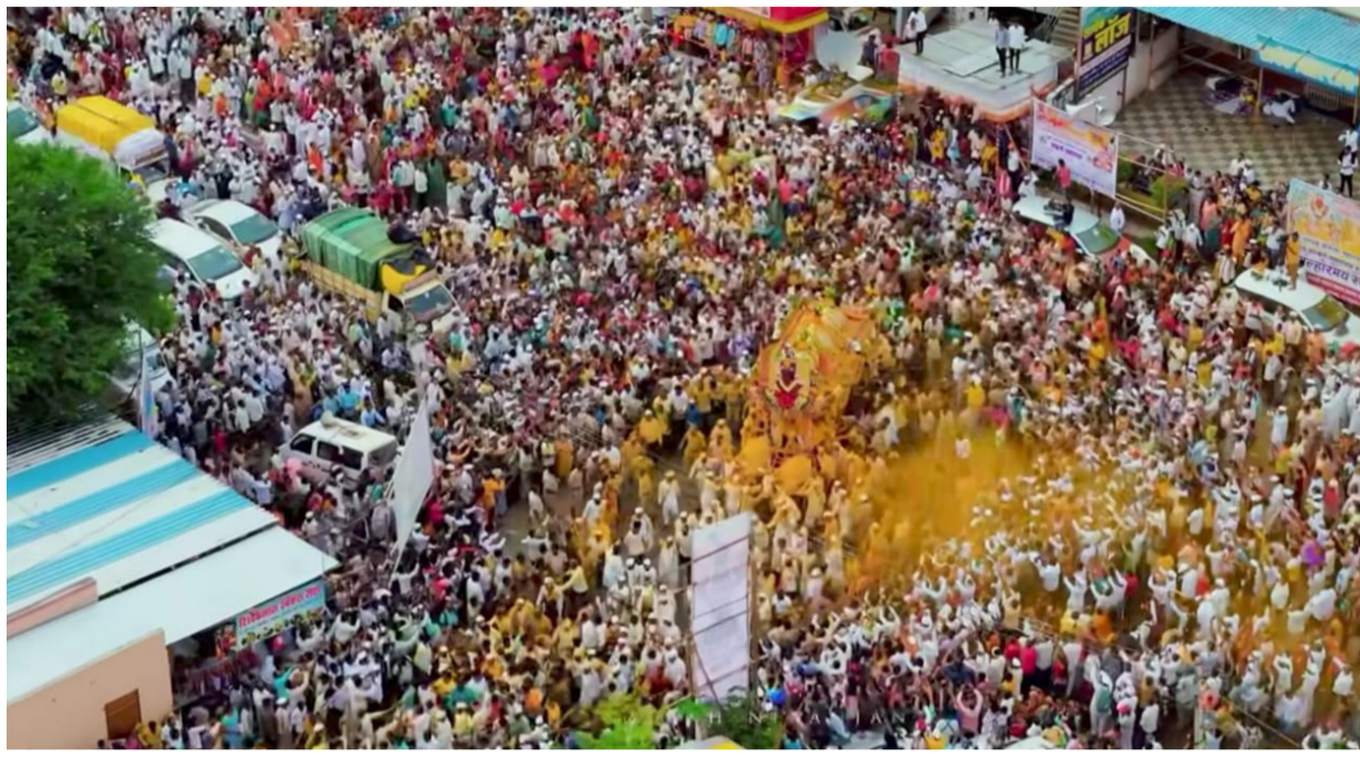
ला. 'येळकोट येळकोट, जय महार' करत खंडोबाच्या जेजुरी नगरीमध्ये सोहळ्याचा मोठ्या उत्साहात स्वागत आणि 'माऊली माऊली' असा गजर संत ज्ञानेश्वर महाराजांच्या पालखी करण्यात आले.

दैनिक यश सिद्धि न्यूज नेटवर्क आषाढी एकादशी जवळ येत आहे. मानाच्या पालख्या पंढरपूरच्या दिशेला रवाना झाल्या आहेत. संत ज्ञानेश्वर माऊलींची पालखी पुण्याहून निघाली आहे. माऊलींची पालखी आज खंडोबांच्या जेजुरीत दाखल झाली. यावेळी जेजुरीकरांनी मोठ्या उत्साहात माऊलींच्या पालखीचं स्वागत केलं. माऊलींची पालखी जेजुरीत दाखल संत ज्ञानेश्वर माऊलींची पालखी आज जेजुरी मुक्कामासाठी दाखल झाली. जेजुरी येथे आल्यावर संत ज्ञानेश्वर माऊलींच्या रथावर जेजुरीकरांनी भंडाच्याची उधळण केली. जेजुरी येथील ग्रामस्थांनी या पालखी सोहळ्याचा मोठ्या उत्साहात स्वागत केले. लाखो वैष्णवजणांनी घेतलं महादेवाचं दर्शन जेजुरी येथे शैव आणि वैष्णवांची