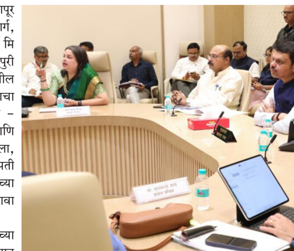
यांनी मिशन मोडवर काम करावे. भूसंपादनाची कामे गांभीर्याने घेऊन तातडीने मार्गी लावावीत. याबाबत सर्वांनी गुणात्मक आणि रचनात्मक काम करावे अशा सूचनाही मुख्यमंत्री