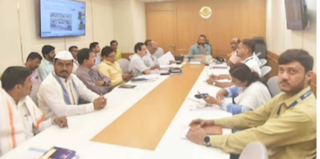
संरक्षण भित्त, मंदिर दुरुस्त व अन्य विकास कामाचे मंजुरी दिली आहे