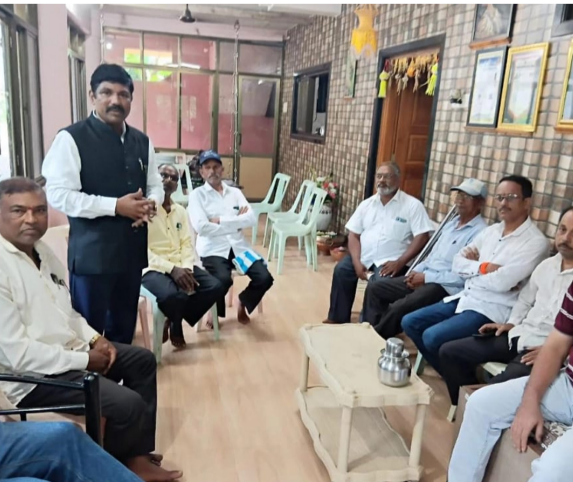
शब्द देऊनही काही शाहीर स्वतःच्याच वचनाला बांधील न राहता या लोककलेच्या संस्कृतीशी प्रतारणा करताना निदर्शनास येत आहे,त्यांना चारंवार समज देऊनही अपेक्षित बदल दिसत नाही,त्यामुळे संबंधित शाहिरांवर कायम स्वरूपाची व ठोस कारवाई करण्यात यावी असा निर्णय समन्वय समितीच्या माध्यमातून घेण्यात आला. या लोककलेला शासन दरबारी न्याय मिळावा यासाठी समन्वय समिती व सलग सर्व मंडळे तसेच संबंधित पदाधिकारी सातत्याने पाठपुरावा करत आहेत, शासनाने आपल्या पदरात अपेक्षित अनुदान

टाकावे यासाठी शासनाला अभिप्रेत असणारी लोककला सादर करणे आवश्यक आहे, पर्यायाने त्यासाठी काही तांत्रिक बदल करण्याची देखील गरज असल्याचे सभे दरम्यान नमूद करण्यात आले.उदाहरणार्थ आपल्या लोककलेचा उगम हा कलगी - तुरा या नावाने झाला आहे आणि त्यानुसार स्थ-पान झालेली आपली मंडळे ही कलगीतुरा समाज उन्नती मंडळ या नावानेच नोंदणीकृत आहेत. शासनाच्या निकषानुसार कलगीतुरा याच नावाने या लोककलेचा प्रचार आणि प्रसार होणे गरजेचे आहे. आज-वर आपण शक्ती तुराअशा आशयाने या लोककलेशी निगडीत जाहिरात करत आलो