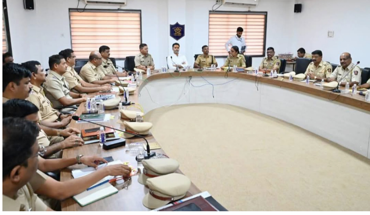
येथे गृह राज्यमंत्री योगेश कदम यांच्या आली. यावेळी ते बोलत होते. अध्यक्षतेखाली आढावा बैठक घेण्यात याप्रसंगी पोलीस आयुक्त.एम.

दैनिक यश सिद्धि न्यूज नेटवर्क सोलापूर, दिनांक ७ (जिमाका):- सोलापूर शहर व जिल्ह्यात मटका, डान्सबार, अवैध मद्य विक्री सह अन्य अवैध व अनाधिकृत व्यवसाय सुरू असल्याच्या तक्रारी आहेत. पोलीस प्रशासनाने अशा अवैध व अनाधिकृत व्यवसाय करणाऱ्या संबंधिताची माहिती घेऊन त्यांच्यावर तात्काळ कारवाई करून ते धंदे बंद करावेत, अशा सूचना राज्यमंत्री गृह(शहरे) महसूल, ग्रामविकास व पंचायत राज, अन्न नागरी पुरवठा व ग्राहक संरक्षण अन्न व औषध प्रशासन मंत्री योगेश कदम यांनी दिल्या.