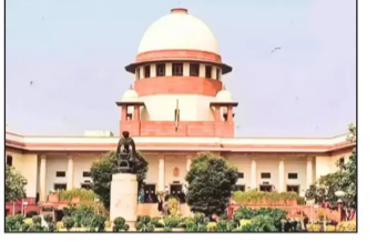
हजार जागा कमी करण्यात आल्या. याविरोधात याचिकाही करण्यात आल्या. त्यावर कोर्टाने ओबीसींच्या जागा कमी न करता निवडणुका घेण्याचे आदेश दिले.