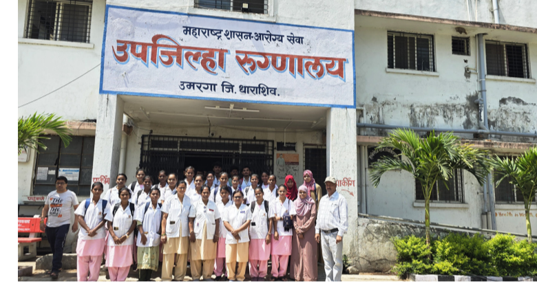
यांनी सांगितले.. तसेच समाजातील दह-ावी बारावी पास युवा युती यांनी जनरल ड्युटी असिस्टंट या कोर्सचा लाभ घ्यावा.