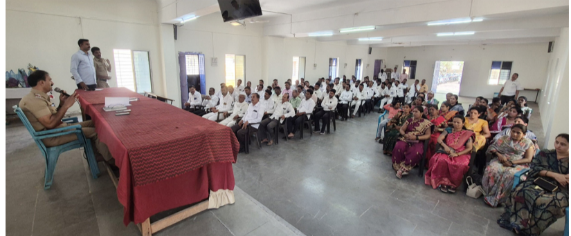
पंढरपूर/प्रतिनिधी : सांगोला तालुक्यात आपापल्या गावी चोरी होऊ नये यासाठी पोलीस मित्र करून रात्री