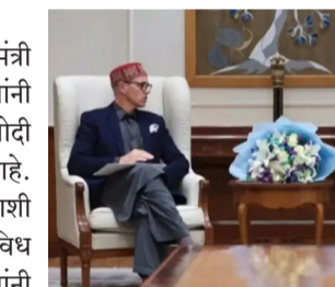
पहलगाम दहशतवादी हल्ल्यानंतर महत्वाची बैठक

दैनिक यश सिद्धि न्यूज नेटवर्क श्रीनगर : जम्मू-काश्मीरचे मुख्यमंत्री उमर अब्दुल्ला (जारी लव्जिथ्रर) यांनी शनिवारी दिल्लीत पंतप्रधान नरेंद्र मोदी (झूच चेवळ) यांची भेट घेतली आहे. यावेळी उमर अब्दुल्ला यांनी त्यांच्याशी पहलगाम दहशतवादी हल्ल्यासह विविध मुद्द्यांवर चर्चा केली आहे, अधिकाऱ्यांनी ही माहिती दिली. पंतप्रधानांच्या निवासस्थानी दोन्ही नेत्यांमधील ही बैठक सुमारे अर्धा तास चालली असल्याचे समजते. पहलगाम येथे झालेल्या दहशतवादी हल्ल्यानंतर दोन्ही नेत्यांमधील ही पहिलीच भेट आहे. या दहशतवादी हल्ल्यात २६ जणांचा मृत्यू झाला. त्यापैकी बहुतेक पर्यटक होते. जम्मू आणि काश्मीरचे मुख्यमंत्री उमर अब्दुल्ला यांनी दिल्लीत पंतप्रधान नरेंद्र मोदी यांची भेट घेतली आणि केंद्रशासित प्रदेशातील परिस्थितीवर चर्चा केली. काही वेळापूर्वीच ते पंतप्रधान निवासस्थानाहून रवाना झाले. पंतप्रधानांच्या निवासस्थानात झालेली ही बैठक सुमारे ३० मिनिटे चालली. पहलगाममधील दहशतवादी हल्ल्यानंतर या बैठकीला महत्त्व प्राप्त झाले आहे.