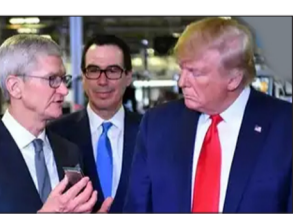
थेट धमकी दिलेली आहे. पलनं अधिकाधिक उत्पादन अमेरिकेत करावं अशी ट्रम्प यांची इच्छा आहे. काही दिवसांपूर्वीच त्यांनी याबद्दल टिम कुक यांना जाहीरपणे सांगितलं होतं. पण त्याकडे दुर्लक्ष करत पलनं भार-तातील आपलं उत्पादन वाढवण्याचा निर्णय घेतला. चीन आणि व्हिएतनामसारख्या प्रमुख उत्पादन हब असलेल्या देशांसोबत अमेरिकेचं व्यापार युद्ध सुरु आहे. त्यामुळे

आयफोन भारतात किंवा अन्य कोणत्या देशात तयार झालेले नसावे. त्यांची निर्मिती भारतातच झालेली असावी असं मी पलच्या टिम कुक यांना आधीच सांगितलं आहे. तसं न झाल्यास पलला कमीतकमी २५ टक्के टॅरिफ द्यावं लागेल,' असा थेट इशारा ट्रम्प यांनी दिलेला आहे. पल भार-तातील उत्पादनात वाढ करणार असल्याच्या बातम्या येत असताना ट्रम्प यांनी कंपनीला