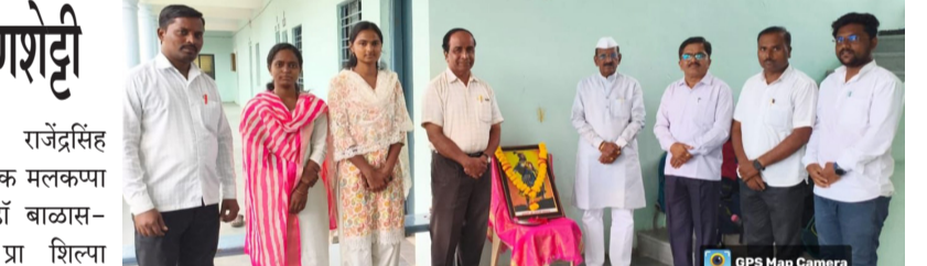
कल्याणशेट्टी महाविद्यालयात इतिहास अभ्यास मंडळाच्या वतीने अभिवादन कार्यक्रम