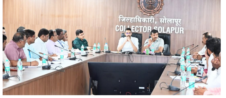
जिल्हाधिकारी, सोलापूर COLLECTOR SOLAPUR