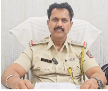
दैनिक यश सिद्धि न्यूज नेटवर्क पंढरपूर/प्रतिनिधी : सध्या राज्यभर गाजत असलेल्या ड्रग्स प्रकरणी १५ आर-