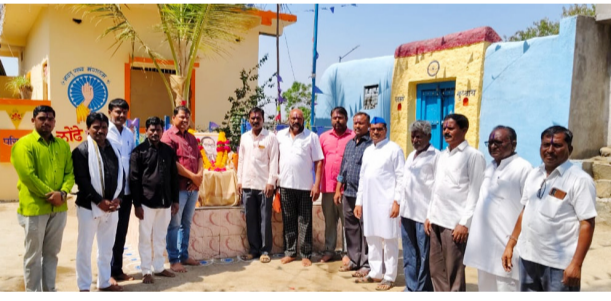
येथे डॉ. बाबासाहेब आंबेडकर जयंती उत्सव कमिटी, सिद्धार्थ कला व क्रिडा मंडळ, सिद्धार्थ बुद्ध विहार कमिटी

: तुळजापूर तालुक्यातील मौजे येथे बाबासाहेब आंबेडकर यांच्या १३४ व्या जयंती निमित्ताने निळा ध्वजारोहन करून डॉ. बाबासाहेब आंबेडकर याना आभिवान करणायत आले. येथील डॉ. बाबासाहेब आंबेडकर जयंती उत्सव कमिटी, सिद्धार्थ कला व क्रिडा मंडळ, सिद्धार्थ बुद्ध विहार कमिटी