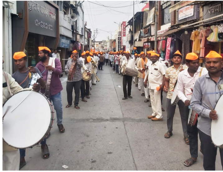
दैनिक यश सिद्धि न्यूज नेटवर्क अक्कलकोट : अक्कलकोट येथे हिंदू नववर्ष महोत्सव समितीकडून भव्य शोभायात्रा काढण्यात आली. शोभायात्रेत पारंपरिक वाद्यासह

फटाक्यांची आतिथबाजी करण्यात आली. शेकडो हिंदू बांधव या शोभायात्रेत सामील झाले होते. पोलिसांनी चोख बंदोबस्त ठेवला होता.