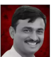
आरोपीचे नातेवाईकांनी येणार गोत्यात