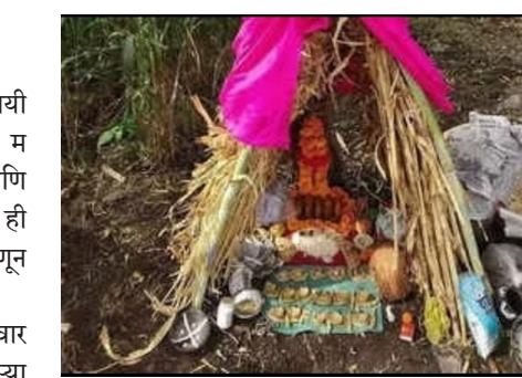
संपूर्ण कुटुंब शेतात असते. सोबतीला मित्र नातलग पै-पाहुणे वन भोजनाचा आनंद लुटायला असतात. या दिवशी