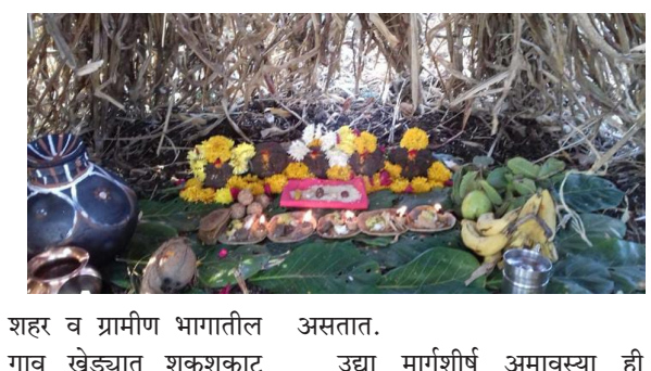
शहर व ग्रामीण भागातील गाव खेड्यात शुक्रशुक्राट असतो निर्मुन्य असते. कर्कश असणारा आवाज, लोकांची वर्दळ, असणारी शहरे, गावे शांत असतात. उद्या मार्गशीर्ष अमावस्या ही म्हणजे वेळा अमावस्या. मुळात अमावस्या म्हणले की एक भिती असते, पण दिवाळी आणि आजची

अमावस्या हे सण आनंददायी सण म्हणून साजऱ्या होणाऱ्या अमावस्या मानल्या जातात. आपल्या महाराष्ट्राला अनेकविध सणांची भलीमोठी परंपरा आहे. त्यातलाच हा एक सण. ही शिवाव गर्दीने फुलून गेले असतात. आणि सोलापूर जिल्ह्यातल्या काही भागात साजरी होते. तसे पाहायला गेले तर हा आहे मूळचा कर्नाटकातला सण. तिथून तो महाराष्ट्राच्या सीमावर्ती भागात आला आहे. उर्वरी महाराष्ट्र मध्ये बहुतेक हा सण साजरा केला जात नाही.