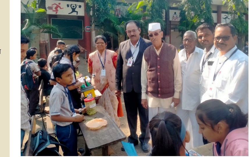
दैनिक यश सिद्धि न्यूज नेटवर्क निफाड/प्रतिनिधी : विद्यार्थ्यांमध्ये कल्पकता, नवनिर्मितीक्षमता आणि वैज्ञानिक दृष्टिकोनाला प्रोत्साहन देण्यासाठी शालेय स्तरावर विज्ञान प्रदर्शनासारखे