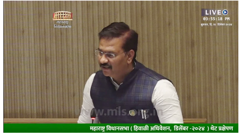
महाराष्ट्र विधानसभा ( हिवाळी अधिवेशन, डिसेंबर-२०२४ ) थेट प्रक्षेपण

पहिल्या दिवशी सदन्याच्या पायऱ्यांवर मी डोके टेकवले. कारण पंढरपूरच्या विठ्ठलाच्या