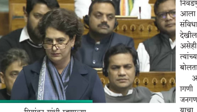
पली लढाई लढण्यासाठी गेली तेव्हा तिला जाळून ठार करण्यात आले, तर आपल्याला काय सहन करावे लागत असेल. मी त्या मुलीच्या वडीलांना भेटले. त्यांची शेती जाळून टाकण्यात आली होती. तिच्या भावांना आणि वडीलांना मारणारा करण्यात आली होती. त्या मूलीच्या वडीलांनी सांगितलं की मुली मला न्याय हवा आहे. माझी मुलगी एफआयआर दाखल करण्यासाठी जिल्हाच्या ठिकाणी गेली तर तिथे तो करून घेतला गेला नाही. तिला दुसऱ्या जिल्ह्यात जावे लागले. ती रोज सकाळी सहा वाजता उठून एकटी ट्रेनेने दुसऱ्या जिल्ह्यात जात होती. तिच्या वडीलांनी मला सांगितलं की मी तिला एकटी जाऊ नको म्हणालो, हा लढा सोडून दे. तर तिने मी एकटी जाईन आणि माझी लढाई मी स्वतः लढेन असं तिच्या वडीलांना सांगितलं. ही लढण्याची क्षमता आणि हिंमत त्या आणि देशभरातली कोट्यवधी महिलांना संविधानाने दिली आहे, असे

दैनिक यश सिद्धि न्यूज नेटवर्क नवी दिल्ली : लोकसभा पोस्ट निवडणुकीत काँग्रेसच्या नेत्या प्रियांका गांधी पहिल्यांदाच खासदार म्हणून संसदेत पोहोचल्या आहेत. त्यानंतर आज पहिल्यांदाच प्रियांका गांधी यांनी लोकसभेत भाषण केले. भाषणाच्या सुरुवातीलाच प्रियांका गांधी यांनी १३ डिसेंबर रोजी दहशतवादी हल्ल्यावेळी संसदेच्या सुरक्षा करत असताना शहीद झालेल्या सुरक्षा कर्मचाऱ्यांना श्रध्दांजली अर्पण केली. संसदेतील आपल्या पहिल्याच भाषणात खासदार प्रियांका गांधी यांनी उत्राव बलात्कार पीडितेच्या वेदना सभागृहासमोर मांडल्या. याबरोबरच संविधानाने महिलांना लढण्याची शक्ती दिल्याचेदेखील प्रियांका गांधी म्हणाल्या. प्रियांका गांधी यांनी सांगितलं की, मी उत्राव येथे बलात्कार पीडितेच्या घरी गेले होते. तिची जाळून हत्या करण्यात आली होती. ती कदाचित २०-२१ वर्षांची असेल. आपल्या सगळ्यांना मुले आहेत. आपण विचार करू शकतो की आपल्या मुलींवर वारंवार बलात्कार झाला आणि जेव्हा ती आ-