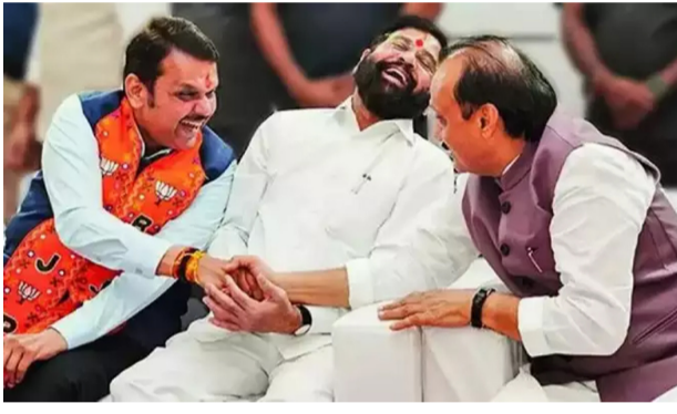
तील आमदारांच्या तक्रारी आहेत. त्यामुळे त्यांना डच्चू मिळण्याची शक्यता अधिक आहे. त्यांच्या जागी नव्या चेहऱ्यांना संधी मिळू शकते.

दैनिक यश सिद्धि न्यूज नेटवर्क मुंबई: महायुती सरकार सत्तेवर येऊन आठवडा उलटला आहे. पण मंत्रिमंडळ विस्तार रखडलेला आहे. गेल्या अनेक दिवसांपासून खातेवाटाबद्दल खलबत सुरु आहेत. महात्वाच्या खात्यांवरून रस्सीच्या च पाहायला मिळत आहे. त्यानंतर अखेर कॅबिनेटच्या विस्ताराला मुहूर्त मिळाला आहे. १५ डिसेंबरला म्हणजेच येत्या रविवारी नागपुरातील राजभवनात शपथविधी सोहळा संपन्न होईल. सोमवारपासून हिवाळी अधिवेशनाला सुरुवात होत आहे. आम दारांची गैरसोय टाळण्यासाठी नागपुरातील राजभवनात शपथविधी सोहळ्याचे आयोजन करण्यात येणार आहे.