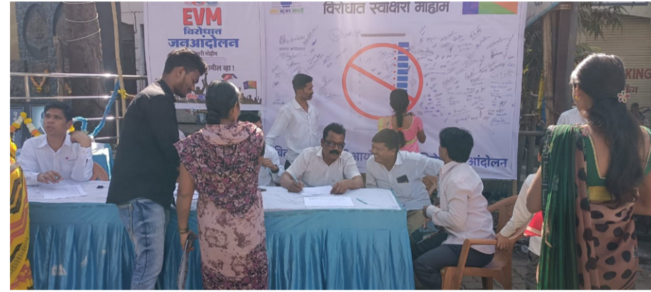
दैनिक यश सिद्धि न्यूज नेटवर्क टिकवण्यासाठी वंचित बहुजन युवा आघाडीने उल्हासनगर प्रतिनिधी/ बाळासाहेब अहिरे म लोकशाहीच्या प्रक्रियेत पारदर्शकता आणि विश्वास