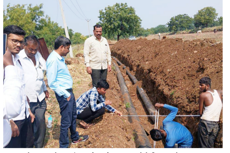
कुरनूर ते अक्कलकोट समांतर पाईपलाईन सुरु असलेले दिसत आहे.