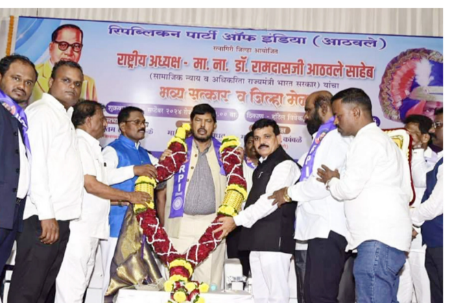
(आठवले) यांच्या वतीने ना.रामदास आठवले यांची तिसऱ्यांदा केंद्रीय मंत्रिमंडळात वर्षा लागल्याबद्दल जिल्ह्याच्या वतीने जाहीर सत्कार करण्यात आला. या सत्काराला उत्तर देताना ना.रामदास आठवले बोलत होते. यावेळी विचारमंचावर रिपब्लिकन पक्षाचे

दैनिक यश सिद्धि न्यूज नेटवर्क रत्नागिरी / प्रतिनिधी : कोकण निसर्ग सौंदर्याने नटलेला आहे. येथे आंबा, काजूसह मासेमारी हे प्रमुख व्यवसाय चालतात. परंतु येथील तरुणांच्या हाताला रोजगार देण्यासाठी येथे उद्योग येणे आवश्यक आहे. देश, राज्याच्या तुलनेत गेल्या ३० ते ३५ वर्षात रत्नागिरी जिल्ह्यात स्ट्रॉसिटीच्या केवळ ३०५ केसेस दाखल झाल्या आहेत. यावरून रत्नागिरीत सामाजिक न्यायाचा सलोखा उत्तम असल्याचे प्रतिपादन रिपब्लिकन पक्षाचे राष्ट्रीय अध्यक्ष केंद्रीय सामाजिक न्याय राज्यमंत्री ना.रामदास आठवले यांनी केले. तर 'वेळ आली तर देईन माझी जान, कोणालाही बदलू देणार नाही देशाचे संविधान' या शायरीने ना.रामदास आठवले यांनी भाषणाला सुरुवात केली. रिपब्लिकन पार्टी ऑफ इंडिया