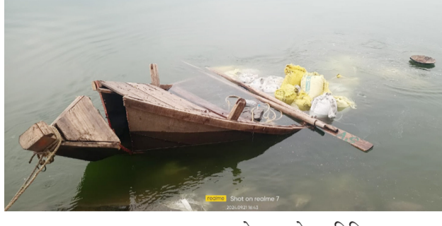
उत्खनन व वाहतूक होत असलेल्या विशिष्ट ठिकाणी धाडी टाकल्या जात आहेत. शेगाव दुमाला येथे दि १९ रोजी दुप-