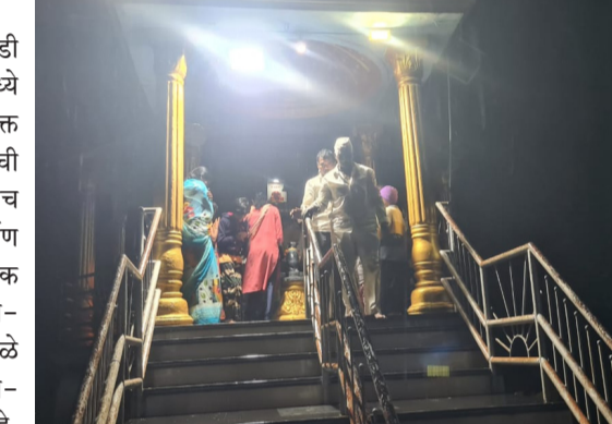
भाविक भक्त येत आहेत. तरी त्वरित भक्तांची मागणी पूर्ण करावी अशी मागणी जोर धरत आहे.

दैनिक यश सिद्धि न्यूज नेटवर्क पत्रकार/नामदेव निर्मळे : टाकळीवाडी तालुका शिरोळ येथील श्री गणेश मंदिरामध्ये संकष्टी निमित्त मोठ्या प्रमाणात भाविक भक्त येत असतात. लहान बालके, वयोवृद्ध यांची गर्दी असते. मंदिरासमोर निवारा शेंद तसेच फरशी नसल्यामुळे पावसामुळे चिखल निर्माण होत आहे.याच चिखलातून दर्शन भाविक भक्त घेत आहेत. दर संकष्टीला महाप्रसादाचे आयोजन करण्यात येते. पावसामुळे प्रसाद देण्यासाठी छोटीशी खोली आहे. पावसात भाविक भक्तांची तारांबळ उडत आहे. तसेच रस्ता अपुरा करण्यात आलेला आहे. या रस्त्यावर गाटारीचे, पावसाचे पाणी येत आहे. यातूनच