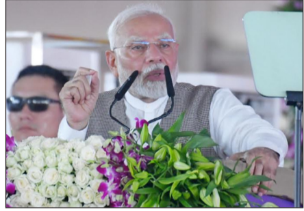
अनावरण प्रधानमंत्र्यांनी केले. सुरुवातीस मुख्यमंत्री एकनाथ शिंदे यांनी चरख्याची प्रतिकृती तर केंद्रीय मंत्री जितनराम मांझी यांनी ग्रामीण कारागिरांनी तयार केलेल्या

तसेच पुण्यश्लोक अहिल्याबाई होळकर महिला स्टार्ट अप योजनेचा शुभारंभ केला. पीएम विश्वकर्मा योजनेच्या १ लाख कारागिरांना ओळखपत्र व प्रमाणपत्र तसेच १ लाख कारागिरांना डिजिटल कौशल्य प्रमाणपत्रांचे वितरण करण्यात आले. देशभरातील ७५ हजार कारागिरांना कर्जाचे वितरण देखील प्रधानमंत्र्यांच्या हस्ते आभासी पद्धतीने करण्यात आले. पीएम विश्वकर्मा योजनेच्या वर्षभूतनिमित्त भारतीय डाक विभागाने काढलेल्या विशेष डाक तिकिटाचे