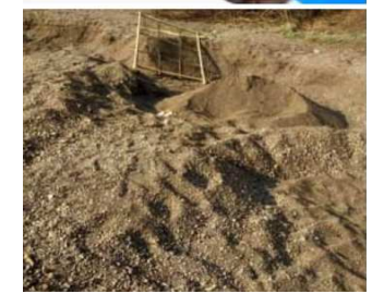
त्या मुळे संबंधित अधिकार्यांनी जातीने लक्ष घालून हे सर्व वाळू