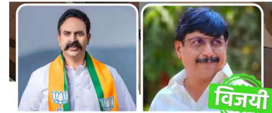
माढा लोकसभा मतदारसंघ

माढा/प्रतिनिधी: माढा लोकसभा मतदारसंघ यावेळी संपूर्ण राज्यभर चर्चेचा विषय ठरला आहे. या मतदारसंघात दिग्गजांची प्रतिष्ठा पणाला लागली आहे.