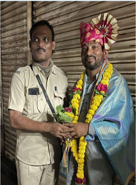
सदाफुले वाहक यांच्या वतीने सत्कार करून शुभेच्छा देण्यात आले