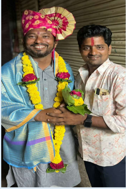
शाम बाबरझयांच्या वतीने सत्कार करून शुभेच्छा देण्यात आले