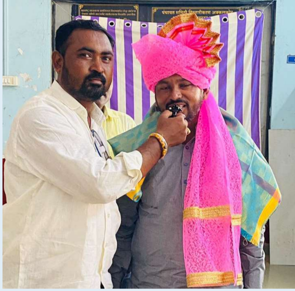
भाजपा अनु विभाग तालुकाध्यक्ष निजपा गायकवाड यांच्या वतीने सत्कार करून शुभेच्छा देण्यात आले