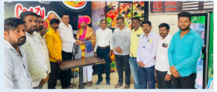
महाराष्ट्र राज्य मराठी पत्रकार संघ अक्कलकोट तालुक्याच्या वतीने सत्कार करून शुभेच्छा देण्यात आले