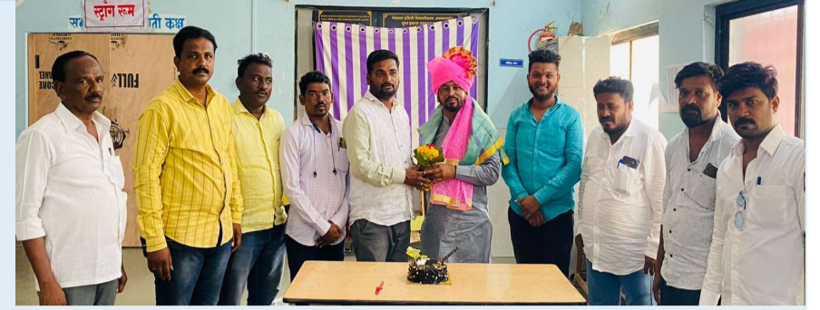
इराण दसाडेसंचालक कृषी उत्पन्न बाजार समिती रुध्नी यांच्या वतीने सत्कार करून शुभेच्छा देण्यात आले