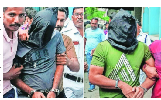
पश्चिम बंगालचे रूपांतर 'दहशतवाद्यांच्या सुरक्षित आश्रयस्थाना'त केले आहे असा

नवी दिल्ली/कोलकाता: बंगळूरुमधील रामेश्वरम कॅफेमध्ये झालेल्या बॉम्बस्फोट प्रकरणात राष्ट्रीय तपास संस्थेने (एनआयए) शुक्रवारी पश्चिम बंगालमधून सूत्रधारासह दोन मुख्य संशयितांना अटक केली. या घटनेनंतर राज्यातील सत्ताधारी तृणमूल काँग्रेस आणि विरोधी पक्ष भाजपदरम्यान शाब्दिक युद्ध सुरू झाले. तृणमूल काँग्रेसने