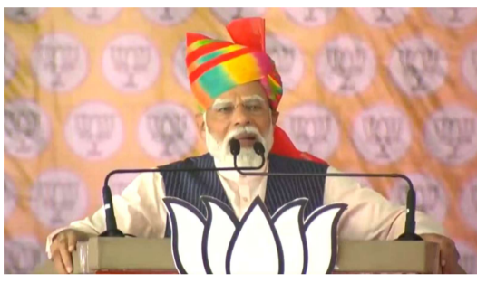
काँग्रेसच्या काळात देशाच्या सीमावर्ती भागात अजिबात विकास झाला नाही.

नवी दिल्ली : पाकिस्तानच्या सीमेलाला गून असलेल्या राजस्थानमधील बाडमेर-जैसलमेर या लोकसभा मतदारसंघात आज (१२ एप्रिल) पंतप्रधान नरेंद्र मोदी यांची जाहीर सभा पार पडली. राज्यातील क्षेत्रफळाच्या दृष्टीने सर्वात मोठा मतदारसंघ असलेल्या बाडमेर-जैसलमेर मधून भाजपाने कैलाश चौधरी यांना उमेदवारी दिली आहे. चौधरी यांच्या प्राचारासाठी स्वतः पंतप्रधान मोदी म्हणाले,