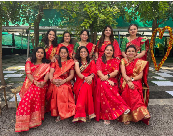
नमस्ते नाशिक फाउंडेशन नवरात्र पहिला दिवस