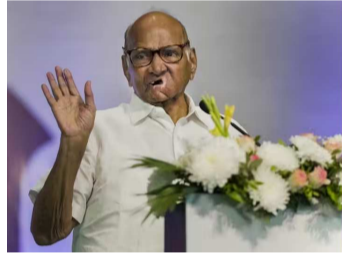
माणसाच्या मनातला निकाल वाचला तर तो निकाल तुमच्या बाजूने लागेल. सध्या निवडणूक आयोगात खऱ्या

म्हणत शरद पवारांनी खेळाडूंचे देखील कौतुक केलं. तर शरद पवार यांनी त्यांच्या भाषणामध्ये भाजपवर निशाणा साधत म्हटलं की, आपल्याला भाजपला सत्तेतून खाली खेचायचं आहे. तर गौतमी पाटीलने नाशिकमधील शाळेत केल्यावर नृत्यावर शरद पवारांनी भाष्य केलं आहे. 'सध्या निवडणूक आयोगात राष्ट्रवादी पक्ष आणि चिन्हावर लढाई सुरु आहे. पण जर त्यांनी सामान्य