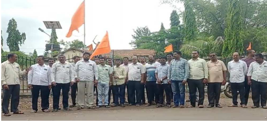
टाकळी/ प्रतिनिधी : जालना जिल्ह्यातील आरक्षणाची मागणी घेऊन आंदोलकांच्याकडून अंतरवली सराटी या गावांमध्ये मराठा २९ ऑगस्ट पासून अत्यंत शांततामय मागणी

आमरण उपोषणाच आंदोलन चालू होतं. आज सायंकाळी चर्चा करण्यासाठी म्हणून आलेल्या पोलिसांच्या कडून अचानक आंदोलकांच्यावर सरकारने त्या ठिकाणी बळाचा वापर करून लाठी हल्ला करून हवत गोळीबार, अशुधुराच्या नळकांड्या फोडण्यात आल्या. आणि आंदोलन दडपण्याचा प्रयत्न केला गेला. त्यामध्ये अनेक आंदोलक बायका मुलासह जबर जखमी झाले. महाराष्ट्र सरकारच्या या दडपशाहीचा निषेध करण्यात आला ३ सप्टेंबर रोजी सैनिक टाकळी संपूर्ण कामकाज बंद ठेवून या घटनेचा निषेध करणार सकल मराठा फाउंडेशन प्रणिता भारतीय मराठा संघ व आंदोलन अंकुश संघटना यांनी केले आहे