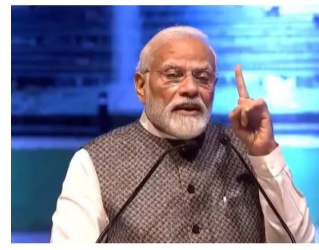
हसाही जारी करण्यात आला. पंतप्रधान म्हणाले की, 'शिक्षणातच देशाचे नशीब बदलण्याची ताकद आहे. देश ज्या ध्येयाने पुढे जात आहे, त्यात शिक्षणाची भूमिका महत्त्वाची आहे. तुम्ही (विद्यार्थी) त्याचे प्रतिनिधी आहात. | पान २ वर

घेतले आहेत. आमच्या विद्यार्थ्यांना नवीन व्यवस्थेची चांगली माहिती आहे. १०+२ शिक्षण पद्धतीच्या जागी ५+३+३+४ शिक्षण पद्धत सुरू केली जात आहे. शिक्षणाची सुरुवात वयाच्या तिसऱ्या वर्षापासून होईल. यामुळे देशात एकरूपता येईल.' यावेळी पंतप्रधान मोदी म्हणाले की, येत्या काळात देशातील सर्व सीबीईईई शाळांमध्ये एकच अभ्यासक्रम लागू केला जाईल. यासाठी २२ भाषांमध्ये पाठ्यपुस्तके तयार केली जात आहेत. दरम्यान यावेळी पीएमएसश्री योजनेचा पहिला