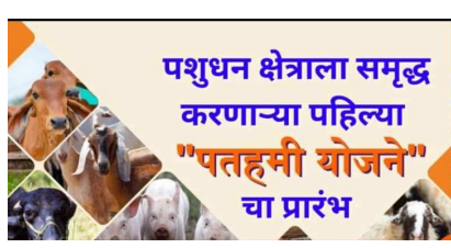
पशुधन क्षेत्राला समृद्ध करणाऱ्या पहिल्या "पतहमी योजने"चा प्रारंभ

नवी दिल्ली : पशुधन क्षेत्रात गुंतलेल्या सूक्ष्म, लघु आणि मध्यम उद्योगांना (एमएसएमई) कर्ज वितरणाची प्रणाली मजबूत करण्यासाठी तसेच जोखीमरहित विनातारण सुरळीत कर्ज उपलब्ध होण्यासाठी, पशुसंवर्धन आणि दुग्धव्यवसाय विभाग, केंद्रीय पशुसंवर्धन, मत्स्यपालन आणि दुग्धव्यवसाय मंत्रालयाने २पत हमी योजना लागू केली आहे. या पशुसंवर्धन पायाभूत सुविधा विकास निधी (AHIDF) अंतर्गत पशुसंवर्धन आणि दुग्ध व्यवसाय विभागाने ७५० कोटी रुपयांचा पत हमी निधी न्यास स्थापन