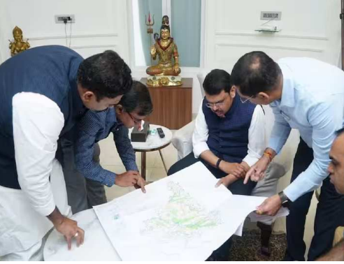
मराठवाडा या भागातील जनतेला दिल्यास मोठ्या प्रमाणात दुष्काळी भागातील जमीन ओलिताखाली येणार असल्याची बाब निदर्शनास खासदार निंबाळकर यांनी

पावसाळ्यामध्ये कोल्हापूर सांगली आणि सातारातील काही भागात मोठ्या प्रमाणात पाऊस झाल्याने कृष्णा नदीतून पाणी वाहून जाते. त्यामुळे कोल्हापूर सांगली सातारा या भागांमध्ये पूरग्रस्त परिस्थिती निर्माण होते. पुराच्या परिणामी जनजीवन आणि आर्थिक नुकसान मोठ्या प्रमाणात होत असते. यासाठी खासदार रणजीत सिंह नाईक निंबाळकर यांनी हे वाहून जाणारे अतिरिक्त पाणी दुष्काळी भागातील जनतेला उपलब्ध करून देण्यासाठी प्रयत्न करत आहेत. हे पाणी सातारा जिल्ह्यातील माण, खटाव फलटण, पुणे जिल्ह्यातील काही भाग, सोलापूर आणि